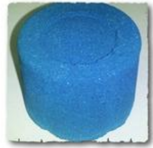
COMFORT BLUE – синій порошковий пігмент

Участь CHEMTECH BAYERN у будівельній виставці BAUMA 2013 у Мюнхені (Німеччина)