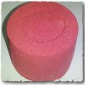
COMFORT RED – червоний порошковий пігмент

Фото готових зразків, які були виготовленні з додаванням 1% пігментів: COMFORT RED , COMFORT YELLOW , COMFORT BLUE + 0,4% добавки-активізатора Color Dry та спеціальної комплексної добавки 0,4% СН4